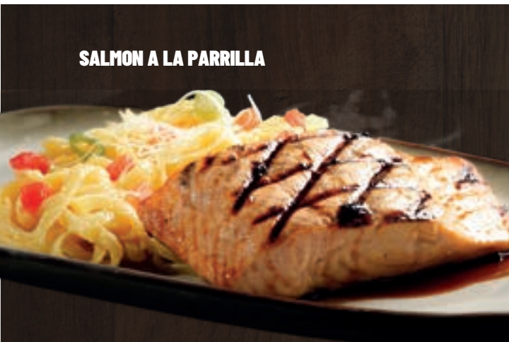
SALMON A LA PARRILLA