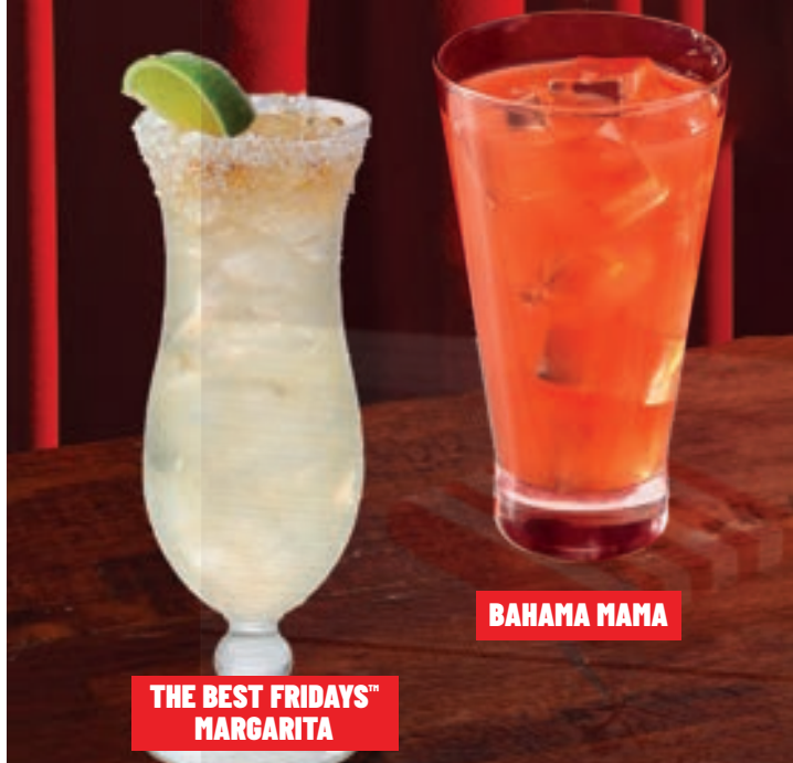
THE BEST FRIDAYS™ MARGARITA

Ron blanco, ron de coco, licor de banana, jugo de naranja y piña granadine.